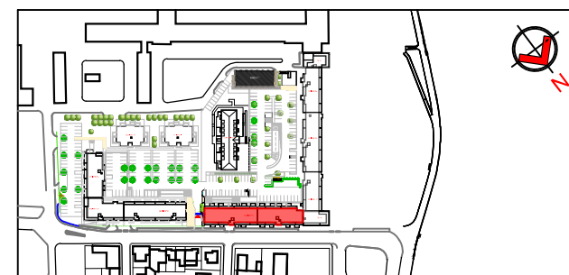
édité le 26.05.2023

Les équipements de cuisine sont positionnés à titre indicatif et non contractuel, la notice descriptive de vente précise expressément les équipements prévus. Les cotes et superficies sont données sous réserve des impératifs techniques de construction et d'exécution. Les retombées de poutres, soffites, les faux plafonds et canalisations ne sont pas systématiquement figurés. Des ajustements techniques peuvent intervenir quant au positionnement des gaines, des équipements sanitaires et des cuisines. L'épaisseur des isolants sera déterminée par l'étude technique d'exécution et de ce fait, les indications portées sur ce plan ne sont qu'indicatives.